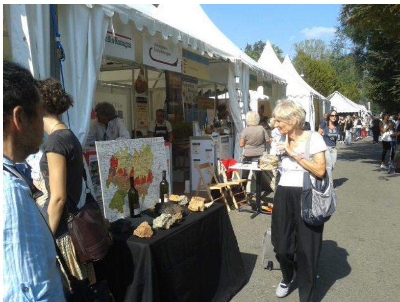
La biodiversità delle terre dei vini, degustazione guidata di terre e Vini piacentini a cura di I.TER