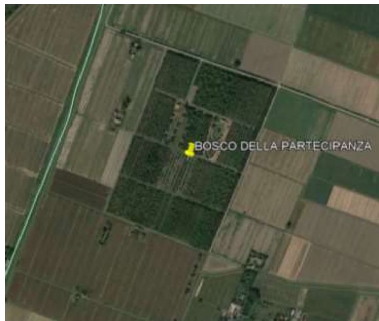
Bosco della partecipazione