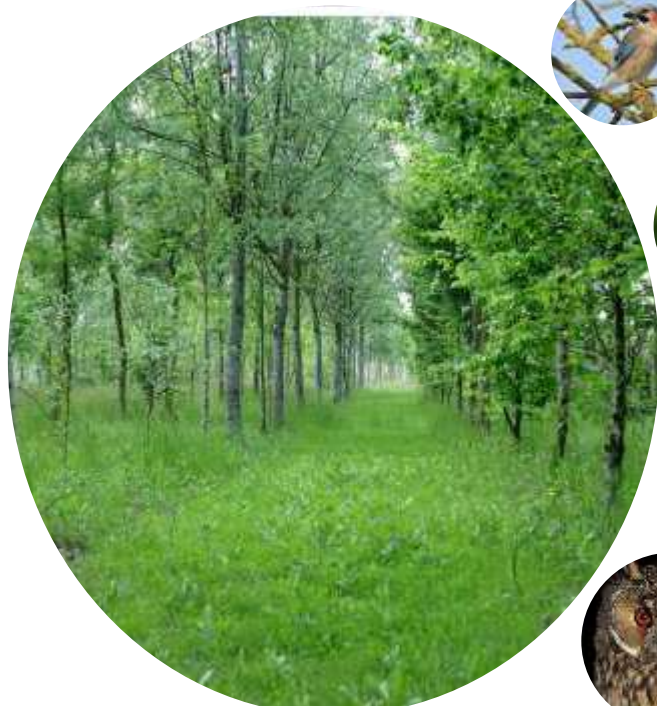
Bosco di Santa Lucia