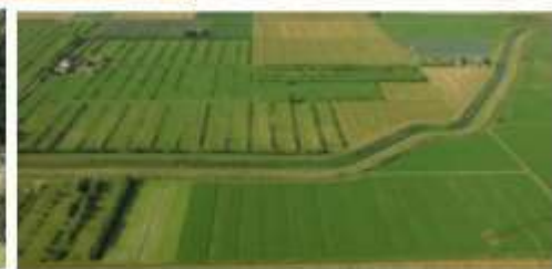
Coltivazioni del territorio